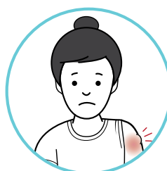
درد، التهاب و ورم در ناحیه تزریق واکسن برای